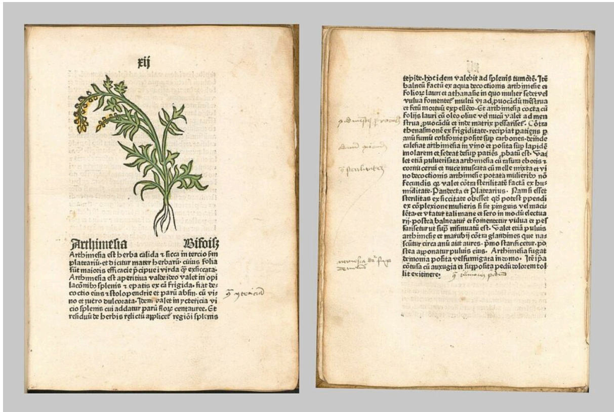
Buchseite aus Peter Schoefflers "Herbarius Moguntinus 1484, Kapitel XII. Artemisia Bifoliz".

Johann von Cube arbeitete am ersten in Deutschland gedruckten illustrierten Kräuterbuch mit.