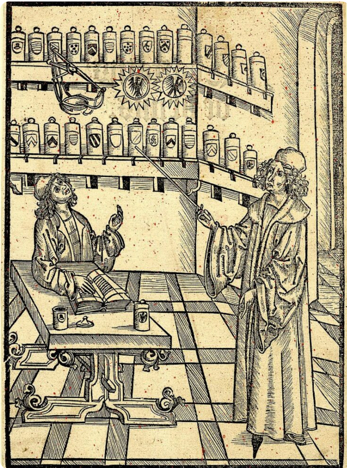
Der Holzschnitt von J. Prüss aus dem Werk "Buch der Chirurgia" von Hieronymus Brunswig (1497) zeigt einen Arzt, der im Laden eines Apothekers Heilkräuter und Medikamente auswählt.